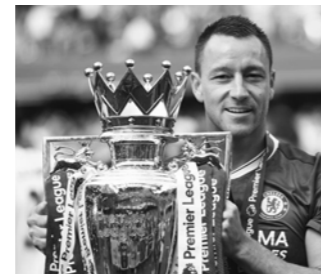
het seizoen op de derde plek in de Premier League. Alleen Manchester City en Liverpool staan er beter voor.

voormalige middenvelder was tussen 2016 en 2019 bij 'The Citizens' de rechterhand van manager Josep Guardiola voordat hij in december 2019 manager bij Arsenal werd. Arsenal won de laatste vier wedstrijden in de Premier League en bezet de vierde plek, die aan het einde van het seizoen recht geeft op een ticket voor de Champions League. Het verschil met koploper Manchester City is twaalf punten.